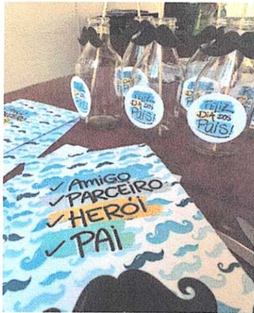
Elaboração dos Mimos para o Dia dos Pais