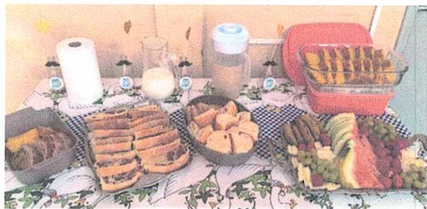
Mesa do Café da manhã Especial Dia dos Pais