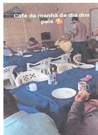
Café da manhã Especial Dia dos Pais