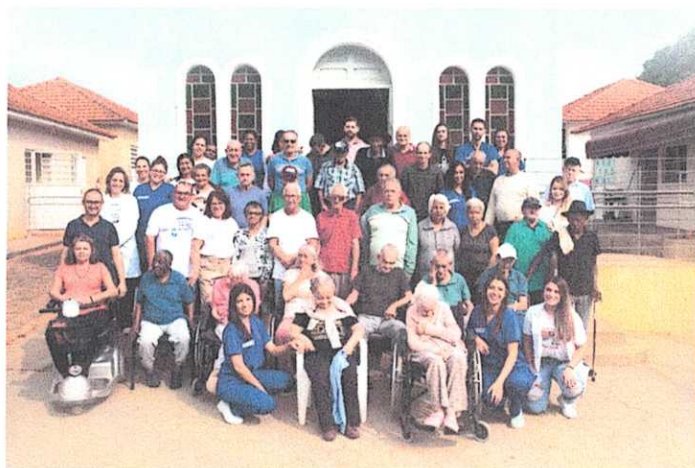
Foto Oficial 2024

Cronograma mensal de atividades em anexo: