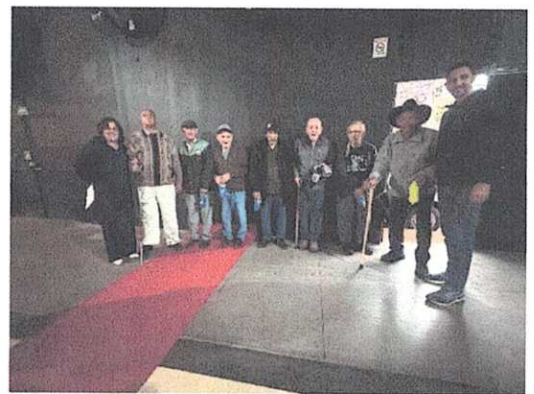
Seleção dos idosos para o Miss e Mister 60+

LAR SÃO VICENTE DE PAULO DE CERQUEIRA CÉSAR