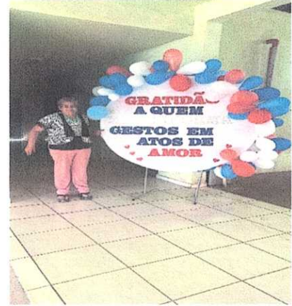
Mural para de agradecimento para o Bingo